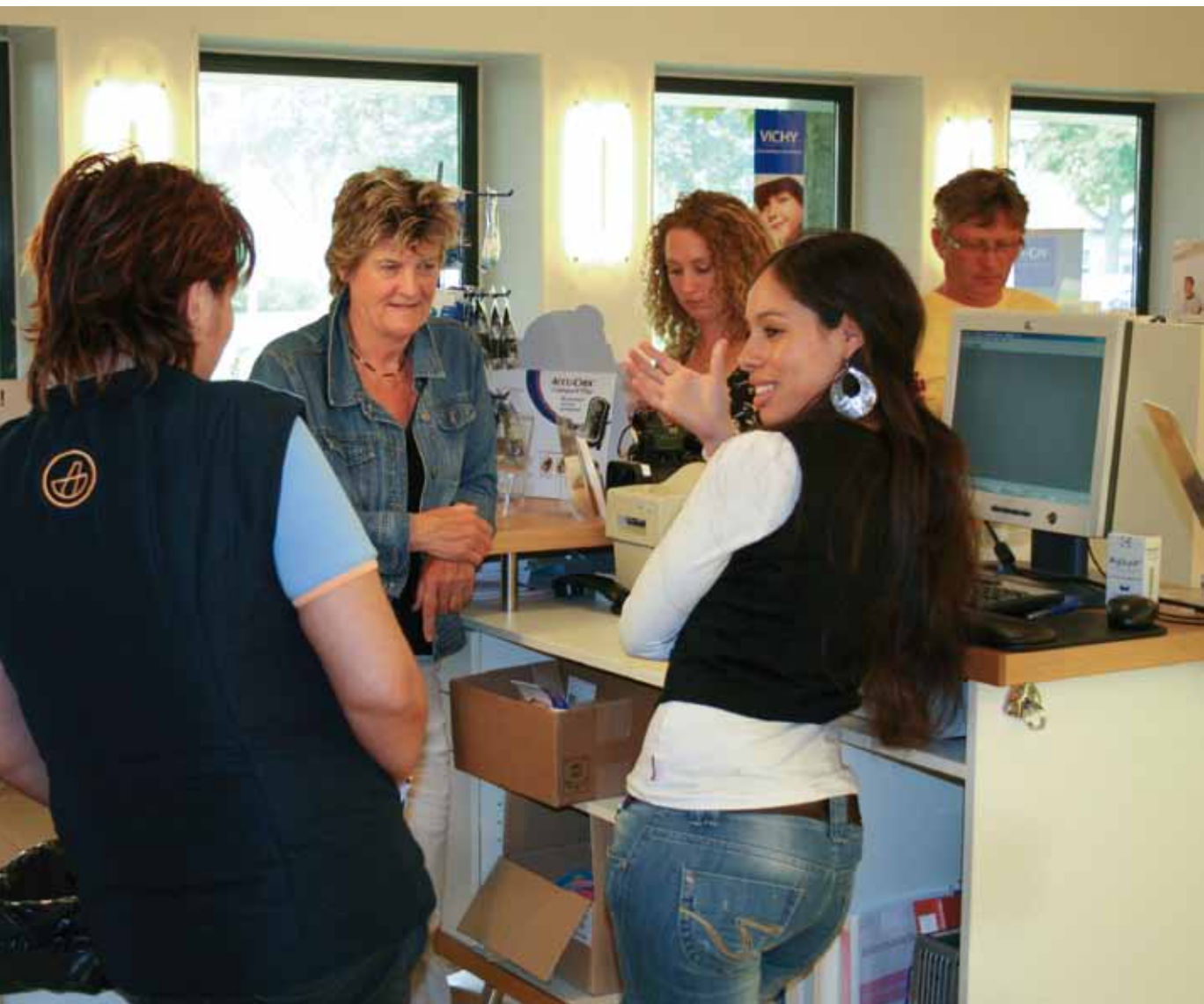
Op de 'set' van de film Onzichtbare taaltaken : een apotheek

volgt: wat betekent dat voor de inhoud van het talenonderwijs? Dat is de vraag voor beleidsmakers en docenten in het mbo: hoe krijgen we de leerlingen zover dat ze in hun eindexamen op een of andere manier kunnen aantonen dat ze de voor dat beroep vereiste taalniveaus beheersen? Beheersing van grammatica en vocabulaire zijn essentieel, dat staat vast, maar daarmee ben je er niet als je de specifieke taaltaken in je beroep wilt kunnen uitvoeren.