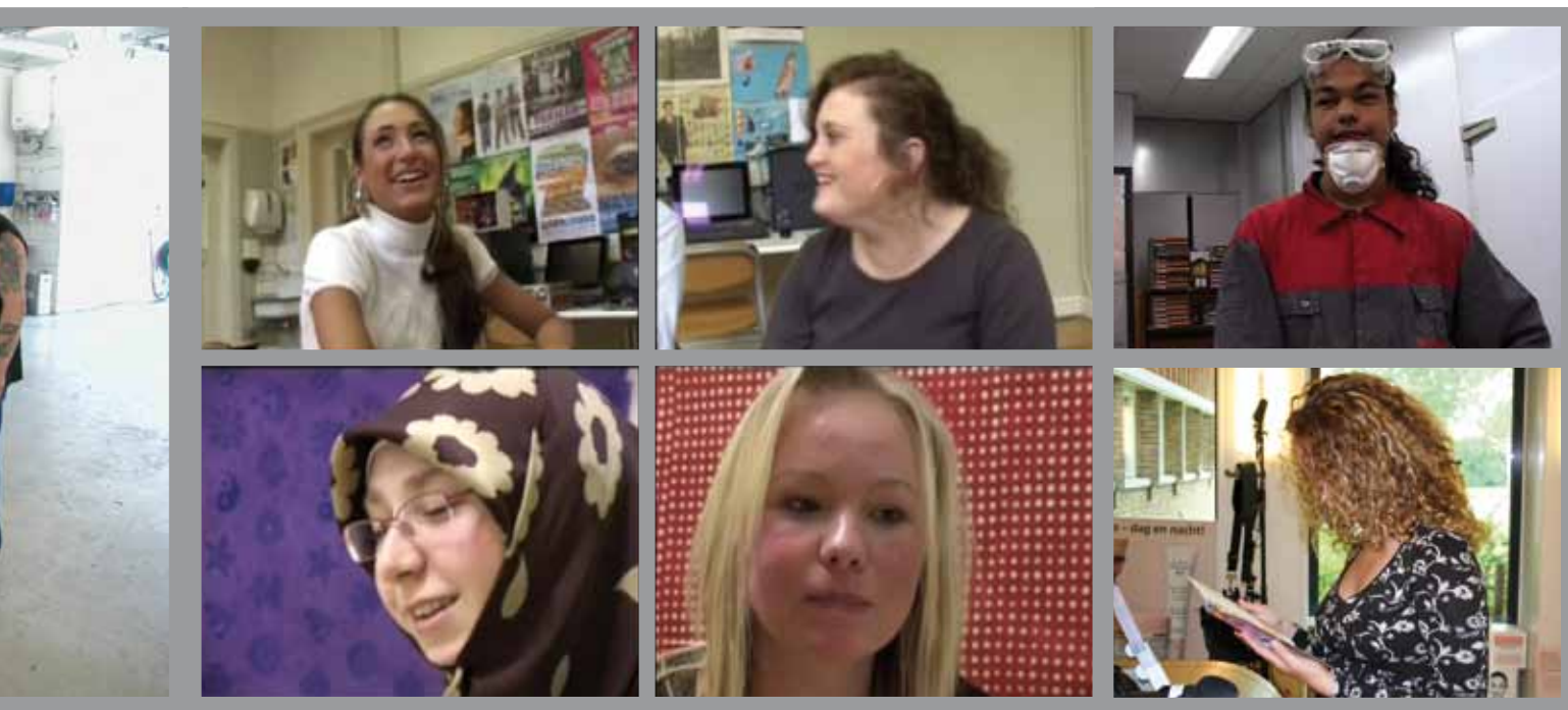
Beelden uit Onzichtbare taaltaken van de filmer Maarten van der Burg

betrof, een stap in de richting van ‘concreet’ en ‘praktisch’.